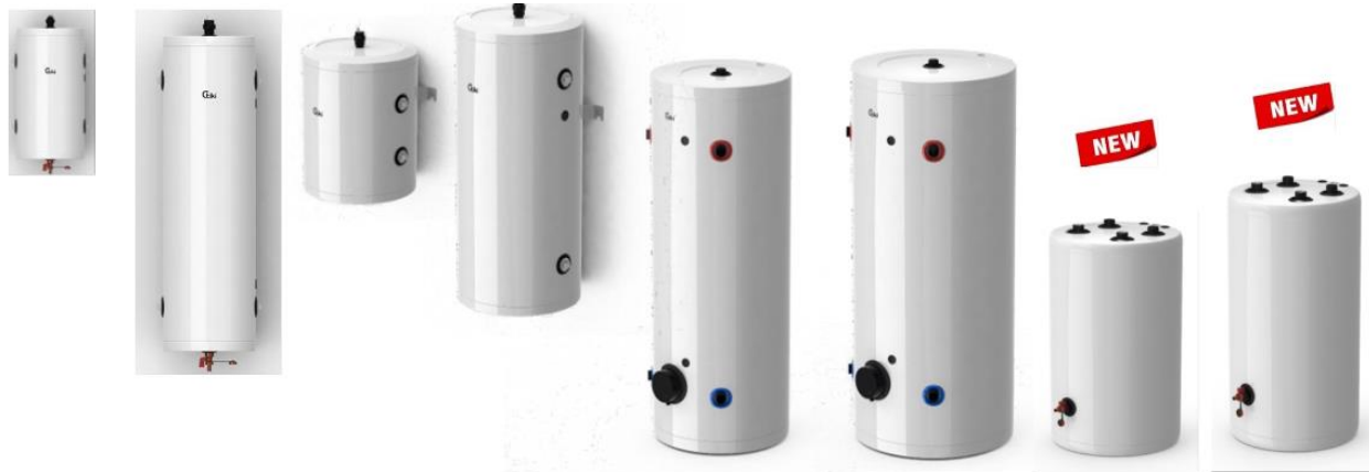
Buffer 25 S